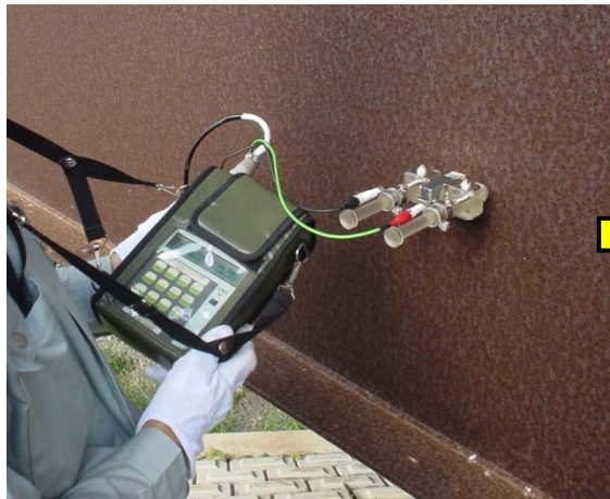
イオン透過抵抗測定装置: RST