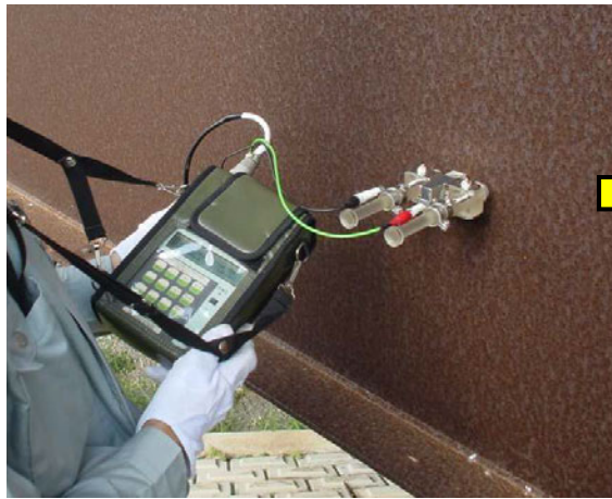
イオン透過抵抗測定装置:RST