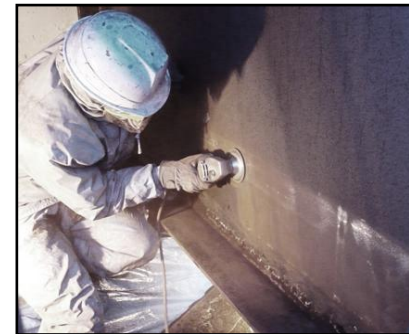
ダイヤモンドツール処理