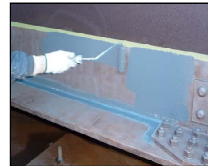
特殊有機ジンクリッチペイント塗布