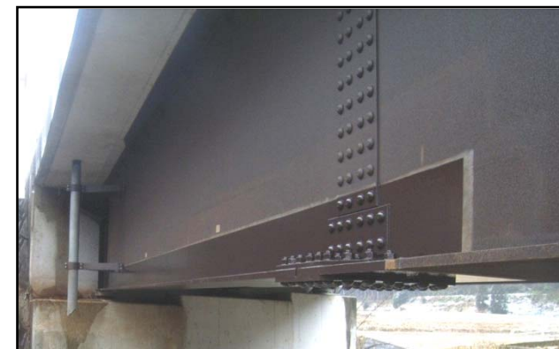
補修(部分)塗装完成