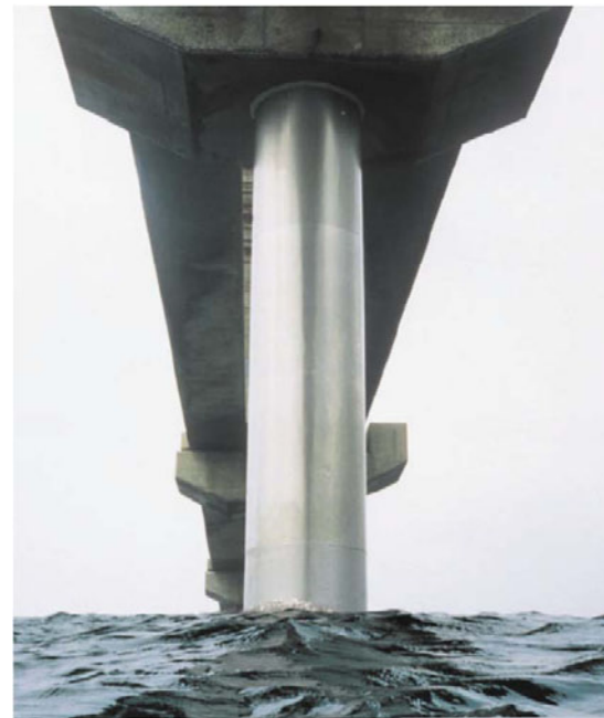
鋼管杭のチタン被覆