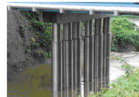
パイルベントのチタン被覆