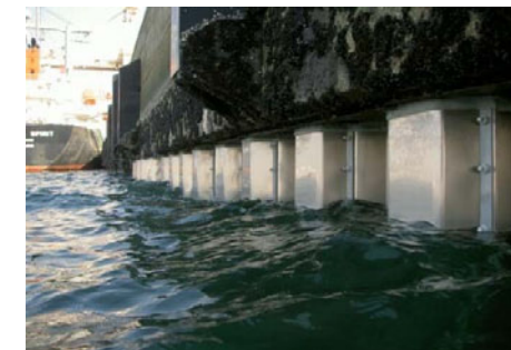
鋼矢板のチタン被覆