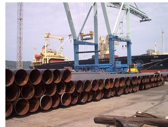
荷降ろしされる被覆鋼管