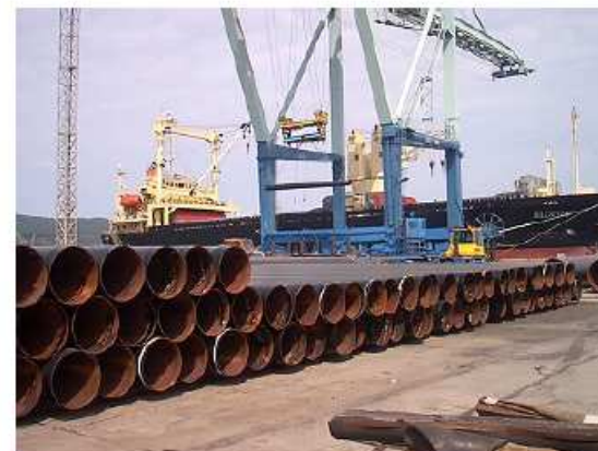
荷降ろしされる被覆鋼管