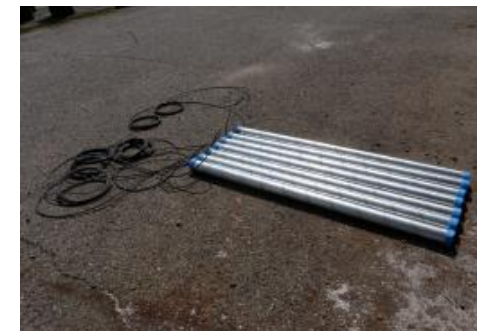
外部電極 (難溶性電極)