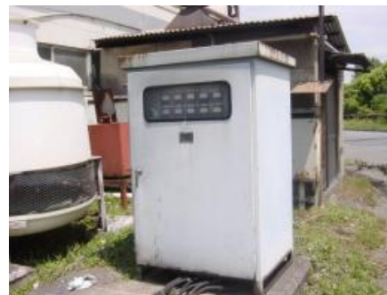
直流電源装置 (屋外型)