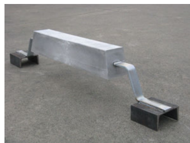
アルミニウム合金陽極外観図

流電陽極には、他にマグネシウム合金陽極、亜鉛合金陽極等があります。その中でもアルミニウム合金陽極は海洋・港湾鋼構造物に最も適しております。