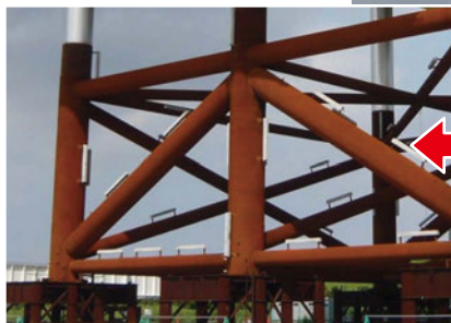
海洋鋼構造物の適用例